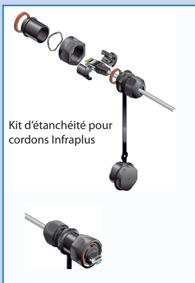
Kit d'étanchéité pour cordons Infraplus